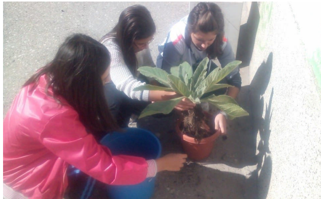
8.Работилнца на тема „Знаци за забрането однесување во околината“